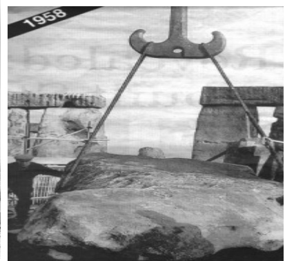
Stonehenge ,restaurálási munkálatok 20-ik században

Brian Edwards megvádolta a kulturális örökséért felelős English Heritage-ot , hogy a turisták előtt eltitkolja a műemlék valódi állapotát , mivel egyetlen kézikönyv , útmutató sem tesz említést arról ,hogy a restaurálás során a négyezer éves oszlopok mekkora átalakuláson estek át. Kutatásai során rávilágított arra , hogy az oszlopokat eredeti helyükről elmozdították, néhányat stabilizációs céllal átfaragtak , megerősítettek , sőt beton alapban rögzítettek.(1919-1920 6 követ , 1958 -oltárkö ,trilithonok,1959 - 3 követ , 1964 – 4 követ)