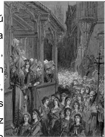
Gyermekek keresztes háborúja, Gustave Doré

embereknek nem sikerült véghezvinni, azt a tiszta szívű, jóakarátú ártatlan gyerekeknek majd sikerül. A nagyszámú gyerek , csak a hitük erejébe bízva ,fegyvertelenül vándorolt a Szentföld felé , Jeruzsálem visszafoglalására. A prédikátorok általában valamilyen egyházi ünnep alkalmával fejtették ki tevékenységüket, ahol más liturgikus események, körmenetek, speciális misék is hozzájárultak a propagandához. Így Stephanus de Cloyes, az 1212-es “gyermekek keresztes háborújának” egyik vezetője valószínűleg a spanyol keresztesek támogatására rendezett Chartres -i körmenet hatására indította el a gyermekek keresztes mozgalmát .